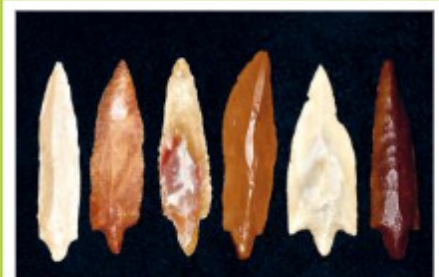
Instrumentos de pedra polida: Neolítico