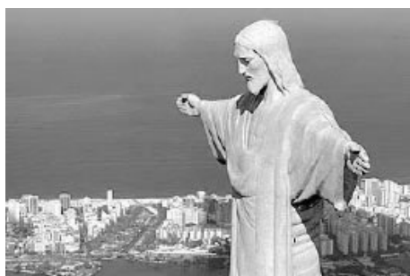
a) Cristo Redentor

Qual das figuras abaixo retrata patrimônio imaterial de um povo?