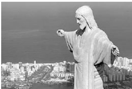
a) Cristo Redentor

Qual das figuras abaixo retrata patrimônio imaterial de um povo?