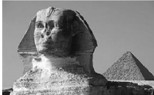
e) Esfinge de Gizé