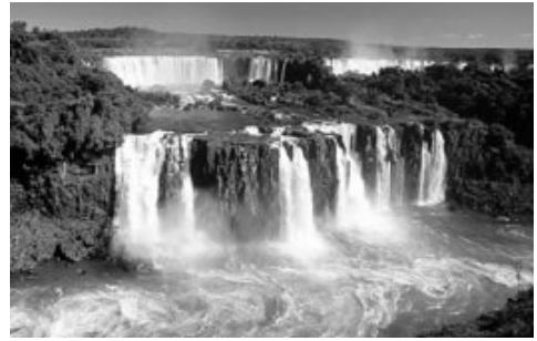
d) Cataratas do Iguaçu