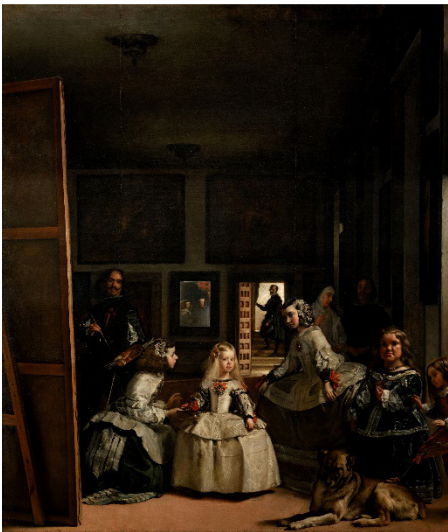
VELÁZQUEZ, Diego. Las meninas , 1656. Museu do Prado, Madri.

(UFG-GO) Observe e compare as duas imagens: