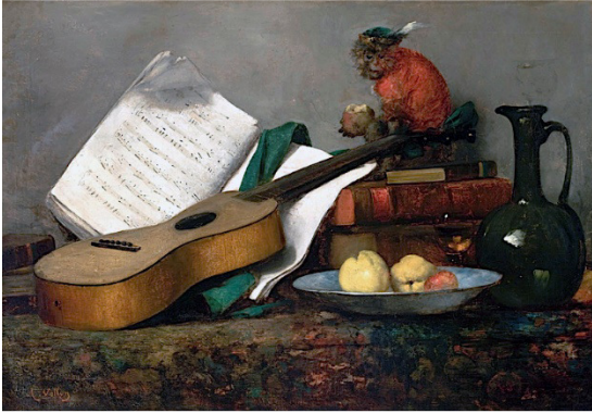
VOLLON, Antoine. Natureza-morta com macaco e violão . 1864. 1 óleo sobre tela, 81 cm x 117 cm. Museu de Arte de São Paulo (MASP), São Paulo.