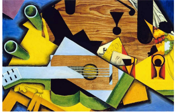
GRIS, Juan. Natureza-morta com violão . 1913. 1 óleo sobre tela, 66 cm x 100,3 cm. Museu Metropolitano de Arte, Nova York, Estados Unidos.

Semelhanças: as duas obras são naturezas-mortas (apesar de serem retratadas em estilos diferentes) e retratam um violão e frutas. Diferenças: o macaco está somente na primeira obra e a escolha de cores é diferente – na primeira, o tom é mais escuro e frio e, na segunda, mais intenso e quente. Características cubistas: decomposição da figura e dos elementos e rompimento com a representação realista da pintura.