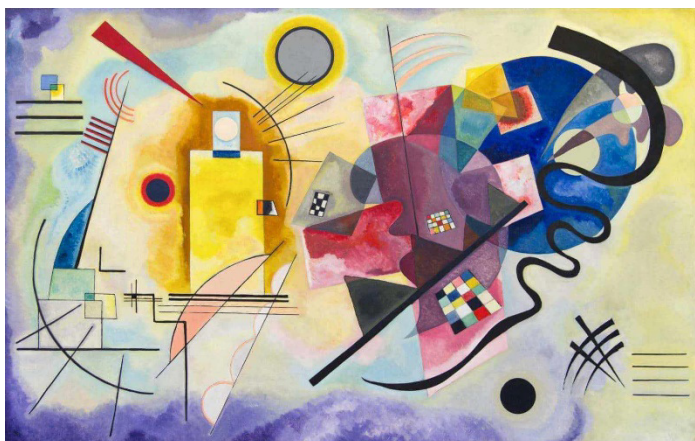
KANDINSKY, Wassily. Amarelo-vermelho-azul . 1925

Expressionismo abstrato (O cavaleiro azul).