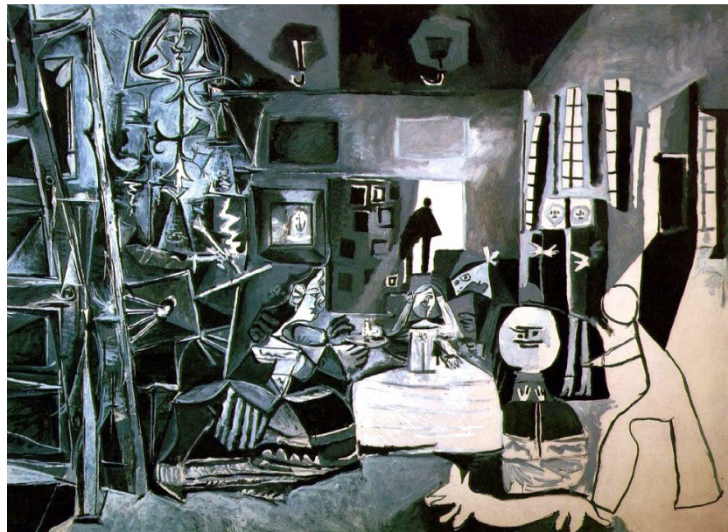
PICASSO, Pablo. Las meninas , 1957. Museu Picasso, Barcelona.

Os quadros tratam do mesmo tema, embora pertençam a dois momentos distintos da história da arte. O confronto entre as imagens revela um traço fundamental da pintura moderna, que se caracteriza pela: