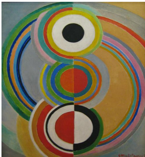
Ritmo, de Sonia Delaunay, 1938.