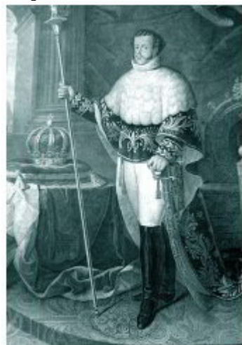
Henrique José da Silva. Retrato do imperador em trajes majestáticos. Gravura sobre metal feita por Urbain Massard 0,64m x 0,44m. Acervo do Museu Imperial.