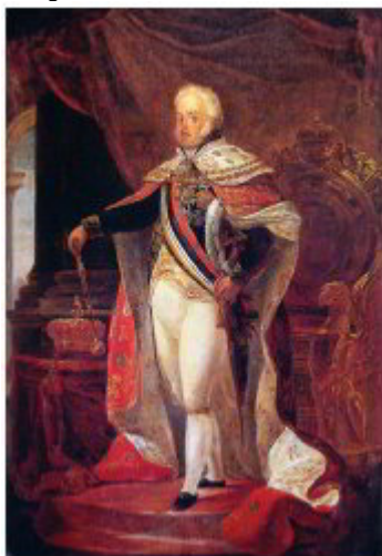
Jean-Baptiste Debret, Retrato de D. João VI, 1817, óleo s/ tela, 0,60m x 0,42m. Acervo do Museu de Belas Artes/IPHAN/MINC. Rio de Janeiro.